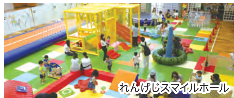
れんげじスマイルホール