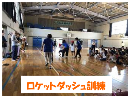
ロケットダッシュ訓練