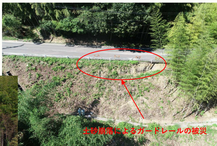
土砂崩落によるガードレールの被災