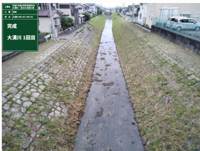
完成 大溝川 1回目