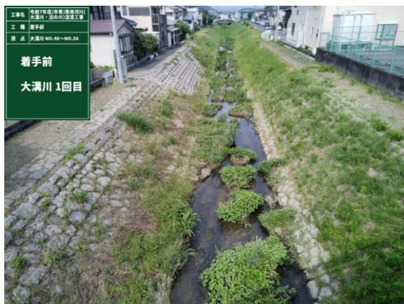
着手前 大溝川 1回目