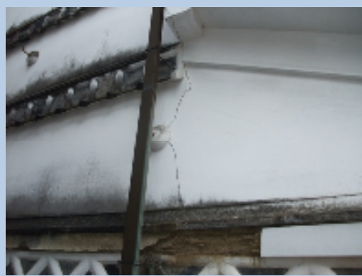
▲壁のひび割れがわかる写真