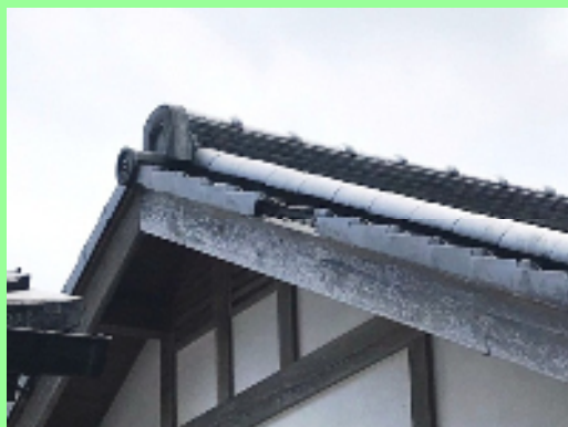
▲瓦の落下がわかる写真