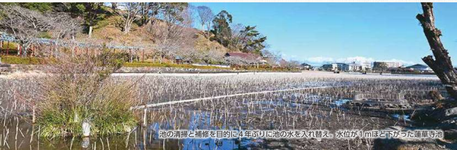
池の清掃と補修を目的に4年ぶりに池の水を入れ替え。水位が1mほど下がった蓮華寺池