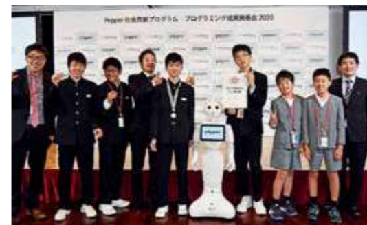
※本市は、「ソフトバンクグループ株式会社Pepper社会貢献プログラム」に参加しています。

2月9日、東京都で、ソフトバンクグループ(株)主催の「Pepper社会貢献プログラム」が行われ、青島小学校・青島中学校・葉梨中学校の3チームが出場しました。フリー部門に出場した青島中学校は、保育士の負担を軽減するため、Pepperが撮影した子どもの写真を家族にメール送信するアプリや、センサー機能を活用した警備システムなどのプログラムを作成。保育園や高齢者施設での実証実験で成果が出たことが評価され、見事銀賞を受賞しました。 本市からは、昨年に続き、2年連続の入賞となりました。