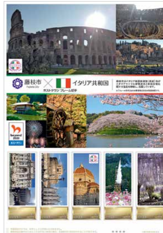
▲フレーム切手イメージ(実物とはデザインなど異なる場合があります。)