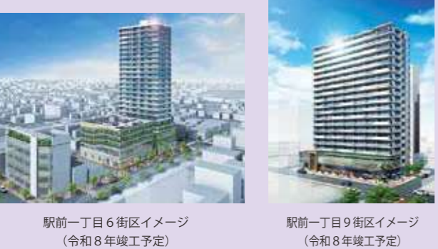
駅前一丁目6街区イメージ（令和8年竣工予定） 駅前一丁目9街区イメージ（令和8年竣工予定）