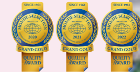
モンドセレクション3年連続最高金賞受賞 インターナショナル・ハイクオリティ称号獲得

※期間外や郵送での受け取りはできません。詳しくは、クーポン画面をご確認ください。