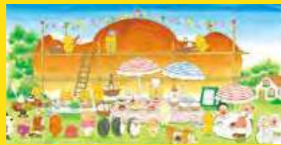
「ノラネコぐんだん パンこうじょう」より

とき 6月4日(土)～7月31日(日) 午前9時～午後5時 (月曜日・祝日の翌日は休館) ※グッズの販売は午前9時～正午、午後1時～4時30分 ところ 郷土博物館・文学館 入館料 600円 (中学生以下無料) ※直接会場へ