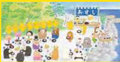
「ノラネコぐんだん おすし屋さん」より