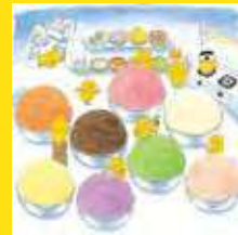
「ノラネコぐんだん アイスのくに」より

「ノラネコぐんだん」は、悪さばかりするけれど憎めない8匹のノラネコを主人公にした人気絵本シリーズ。県内初の開催となる本展では、作者・工藤ノリコさんの手描き原画やイラストなど約250点を展示します。ノラネコたちとの記念撮影コーナーや、豊富なオリジナルグッズの販売もあります。ユーモラスな世界を家族でお楽しみください。 郷土博物館・文学館 ☎645・1100