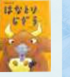
むらまつけーじ「はなとりじぞう」

宇津ノ谷峠の西側の登山口にある地藏堂。ここに祭られているお地藏様は「鼻取り地藏」とも呼ばれ、歩かなくなった牛を動かしたり、稲刈りを手伝ったりして村人を助けた伝説があり、あつく信仰されていました。