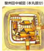
郷土博物館・文学館所蔵

田中城の本丸にあった櫓で、現在は田中城下屋敷の敷地に移築・展示されています。田中城は戦国時代に築城されてから、明治時代に廃城となるまでの約500年間、この地域の政治の中心でした。田中城は、全国でも珍しい円形の縄張りを持つ城としても有名で、三の丸の形が亀の甲羅に似ていたことから、亀城とも呼ばれていました。