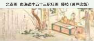
郷土博物館・文学館所蔵

東海道に面した瀬戸の茶屋で売られていた名物で、強飯(蒸したもち米)をクチナンの実で黄色く染めてすりつぶし、小判形や四角形などにして乾燥させたもの。クチナンは消炎・解熱などに効く漢方薬として知られており、足腰の疲れを癒やす食べ物として旅人に重宝されました。その歴史は古く、戦国大名・織田信長の事績を記した信長公記にも記載されており、戦国時代から名物として有名でした。