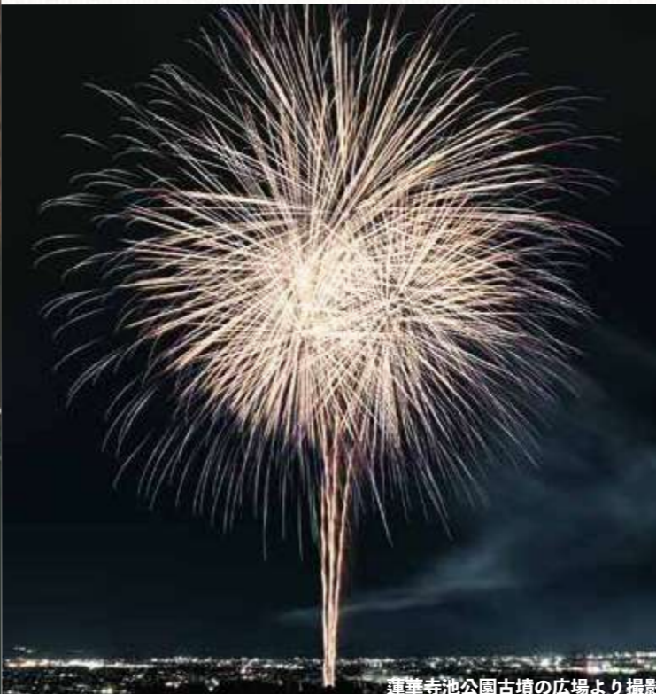
蓮華寺池公園古墳の広場より撮影