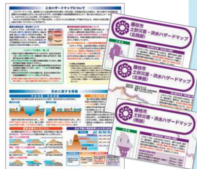
土砂災害・洪水ハザードマップ