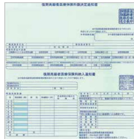
後期高齢者医療保険料額決定通知書

後期高齢者医療保険料は、加入者の医療費に充てられる大切な財源です。必ず納期限までに納めましょう。☎国保年金課 ☎643・3307