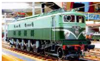
原鉄道模型博物館所蔵

横浜にある原鉄道模型博物館の協力を得て、世界的に著名な鉄道模型作家であった原信太郎が細部までこだわって設計・製作した精巧な鉄道模型コレクションを展示します。日本の鉄道からヨーロッパ・アメリカの鉄道まで、世界各地の鉄道を約100点の模型でたどります。