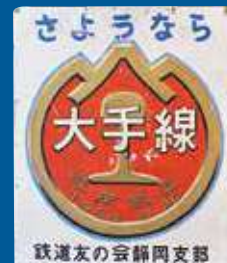
焼津市歴史民俗資料館所蔵

本年は、藤枝大手駅～袋井駅間を走っていた軽便鉄道「静岡鉄道駿遠線」が廃止となった1970年（昭和45）から50年の節目を迎えます。廃線50周年を記念し、駿遠線関係の貴重な資料・グッズや精巧な軽便の模型・ジオラマなどを展示します。駿遠線の在りし日の姿や懐かしい沿線風景を振り返ってみましょう。