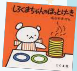
わかやまけん作 「しろくまちゃんのほっとけき」