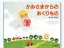
ひぐちみちこ作 「かみさまからのおくりもの」

☎644・8514 ✉muse@city.fujieda.shizuoka.jp