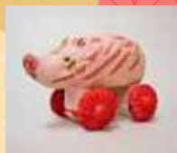
鴻巣練り物(埼玉) 〈猪車〉