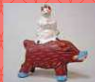
伏見土人形(京都) 〈狐の猪乗り〉