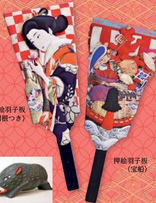
押絵羽子板 〈羽根つき〉