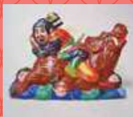
坊ノ谷土人形(静岡) 〈仁田四郎〉