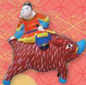
伏見土人形(京都) 〈猪乗り武者〉

今年の干支にちなんだ全国各地のイノシシの郷土玩具や、正月遊びの羽子板を展示しています。ぜひ、ご覧ください。☎郷土博物館・文学館 ☎645・1100