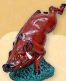
津屋崎土人形(福岡) 〈猪〉