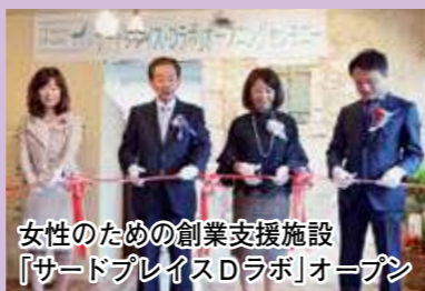
女性のための創業支援施設「サードプレイスDラボ」オープン