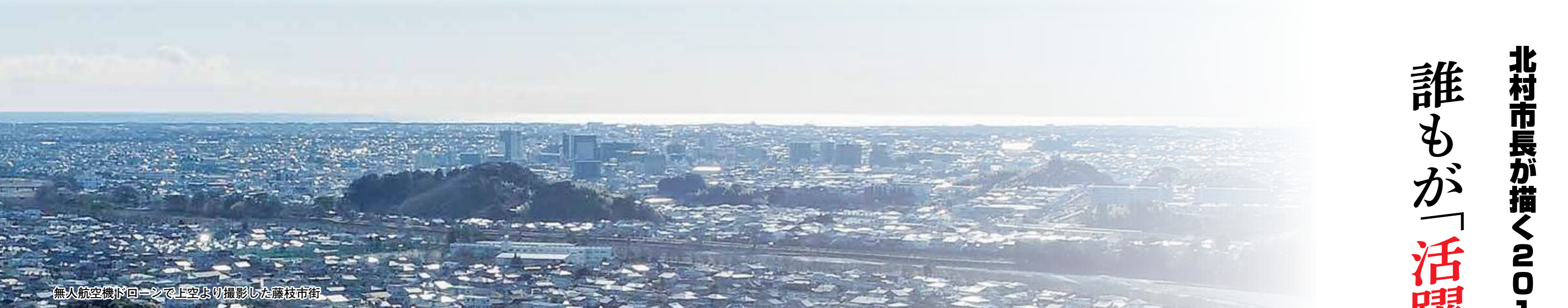
無人航空機ドローンで上空より撮影した藤枝市街