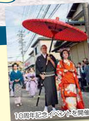
10周年記念イベントを開催