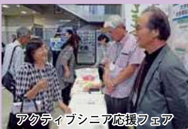
アクティブシニア応援フェア