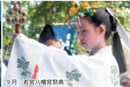
9月 若宮八幡宮祭典