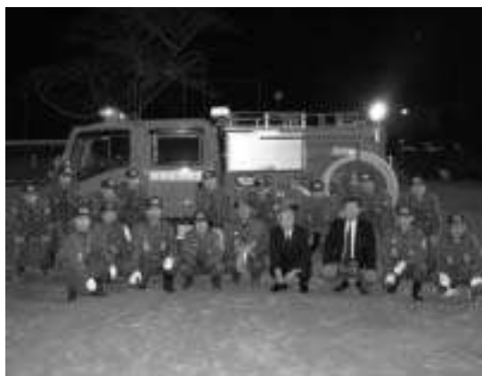
新たに配備された消防ポンプ車と宮島班消防団員

自治総合センターでは、宝くじの普及広報事業の一環として、地域のコミュニティ活動を推進するため、備品の購入事業に対し助成を行っています。この事業により、11月にオレンジ町内会に次の備品が整備されました。備品は町内会のコミュニティ活動に利用されます。 【整備された備品】 テレビ・DVDレコーダー、プロジェクター・スクリーン、ノートパソコン、エアコン、会議用テーブル、キャビネット、複写機、テント