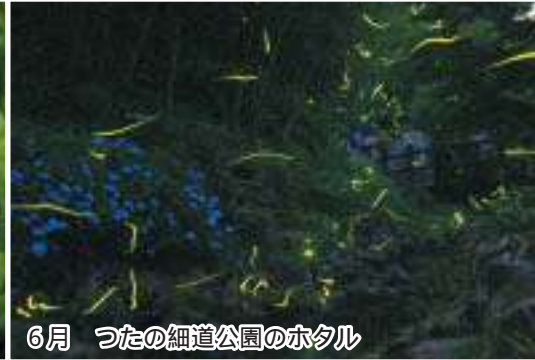
6月 つたの細道公園のホタル