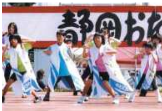
静岡市で開催されたおだっくい祭りに「風と緑の歌」創作踊りチームが出演(平成17年)