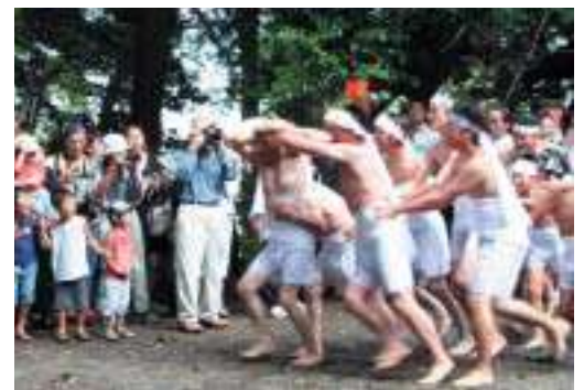
創祀千百年を迎えた若宮神社で行われた神事「神ころばし」(平成20年)