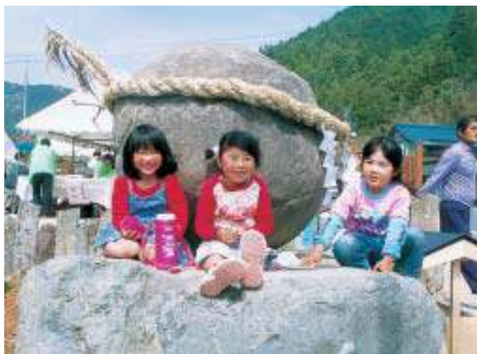
「たまゆら」の名前の由来にもなった玉取で見られる不思議な玉石(平成16年)