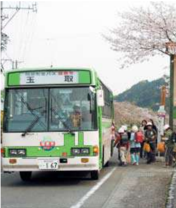
岡部小から玉取までを結ぶ町営バス「龍勢号」運行開始(平成19年)