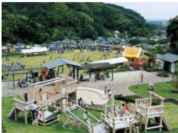
高台にある開放的な芝生広場が人気の貝立公園(平成16年)

町制施行50周年を記念して平成16年、朝比奈活性化施設「たまゆら」、貝立公園、五智如来公園が落成しました。たまゆらは、玉取地域住民の活動拠点として整備されました。毎週末に地元の特産物や加工品を販売する「たまゆら市」が開かれているほか、古代米やそばの栽培、玉露の茶摘み体験などを通して都市部の人たちと地域住民の交流を図っています。