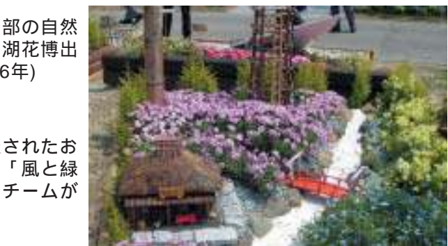
朝比奈川と岡部の自然を表現した浜名湖花博出展の花壇(平成16年)

平成19年、藤枝市と一市一町の合併を目指す「藤枝市・岡部町合併協議会」が設置され、平成21年1月1日の合併に向けて協議が始まりました。町では住民説明会を開催し、協議された内容を報告、住民の皆さんの意見や質問を伺いました。平成20年には、藤枝市長、岡部町長が合併協定書に調印しました。