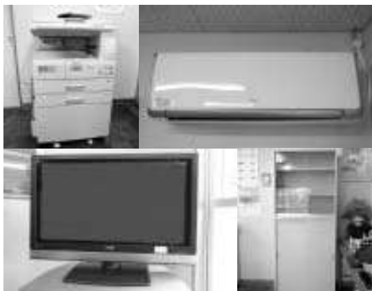
エアコン 複写機 キャビネット テレビ

10/22 29 町茶振興協議会(井田久義会長)は、パリ国際食料見本市や茶専門店などで朝比奈玉露を中心に、かぶせ茶、抹茶を紹介するため、柴田副町長を団長に、生産者茶商など17人がパリを訪れました。フランスでは近年の日本食ブームで日本茶が注目を集めています。食料見本市で玉露茶を紹介したほか、パリ市内の茶専門店などでつゆ茶を味わってもらい、朝比奈玉露のPR活動を行ったほか、日本食レストラン、日本食食料店でかぶせ茶・抹茶のPR活動を行いました。いずれの店でも大好評でした。