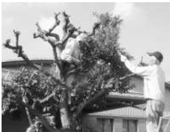
高さ3mの樹上で剪定を行う会員