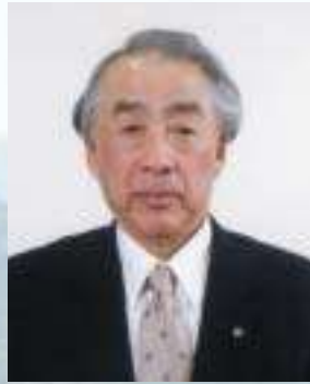
岡部町長 井田久義