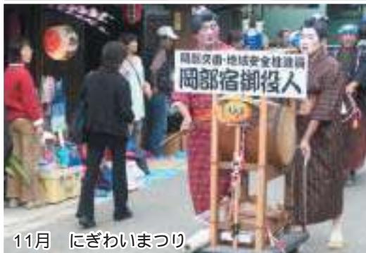
11月 にぎわいまつり