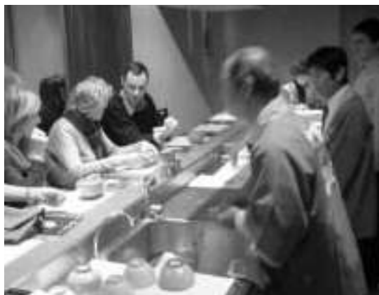
興味深く岡部のお茶を味わうパリの人たち

11/17 岡部町シルバー人材センターの皆さんが役場と町民センターおかべの2カ所、樹木の剪定や清掃などの奉仕作業を行いました。この活動は今年で18年目になります。町民センターおかべでは、会員が施設の周囲を囲む樹木に登り、手際よく枝を剪定していました。藤枝市との合併に伴い、岡部町シルバー人材センターは藤枝市と統合します。11月11日に統合協定書などの調印式が行われ、平成21年4月からは藤枝市シルバー人材センターとして活動を行っていきます。