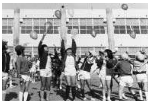
音楽室や理科室など、特別教室の完成を喜ぶ岡部小学校児童。(昭和54年)