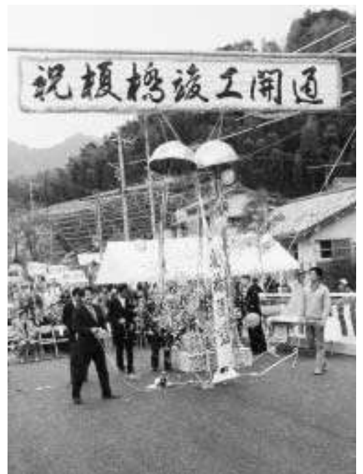
新舟と笹川を結ぶ町道に新しく完成した榎橋の開通式。(昭和56年)