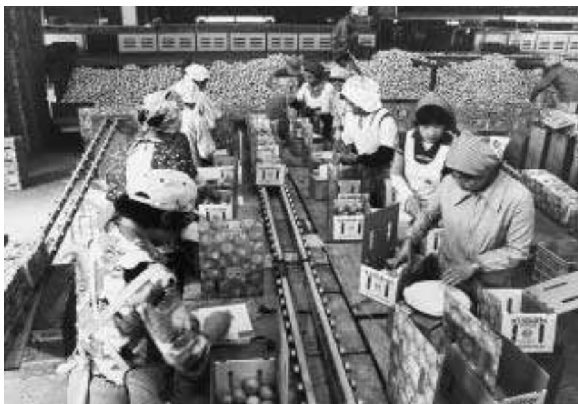
カナダへ輸出するみかんの箱詰め作業で活気づく農協の共撰場。(昭和56年)