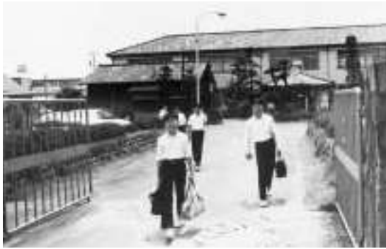
統合前の岡部中学校

昭和51年、横添から内谷新田までを結ぶ岡部バイパスが開通しました。当時は2車線の対面道路で、内谷のインターチェンジで国道一号に接続していました。バイパスの開通により、町内で交通事故が多発していた国道1号の交通量が緩和されました。 昭和53年には、広域市町圏事業の一環として、志太2市2町リサイクルセンターが完成しました。埋立地の減量を図るため、家庭から出された不燃物を集められ、ビン、鉄、アルミなどを再生資源として回収が始まりました。婦人会や町内会などの施設見学も頻繁に行われ、燃えないごみを出すときのマナーや、ごみ減