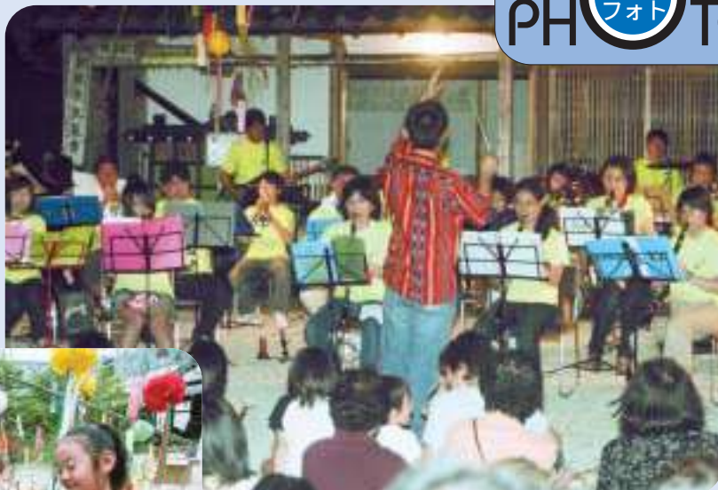
中庭で行われた七夕コンサート