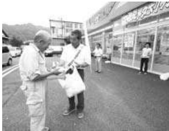
町内のドラッグストアの前で行われた啓発活動

7/11 7月11日から20日に行われた夏の交通安全県民運動にあわせ、岡部町交通安全対策協議会では、町内2カ所で行った街頭指導を実施しました。 今年の運動では、特に子どもと高齢者の交通事故防止、自転車の安全利用の推進、後部座席を含む全ての座席でのシートベルト着用の徹底について呼びかけました。 参加者は、交差点でのぼり旗を立てて車の運転者に交通安全を呼びかけたり、自転車で登校途中の生徒に自転車の走行マナーを指導しました。