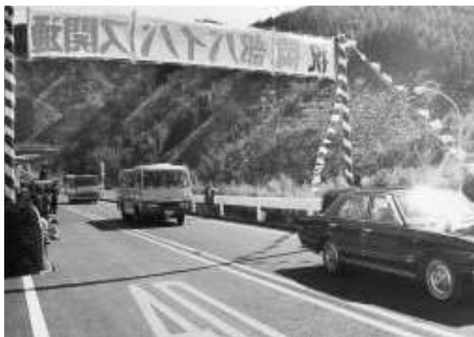
岡部バイパス開通により、国道1号の交通環境が改善されました。(昭和51年)