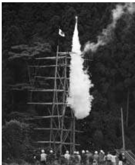
人々の思いをのせて打ち上げられる大龍勢。(昭和53年)