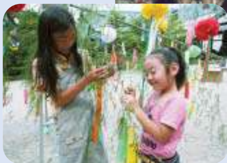
願いを込めた短冊を丁寧に結ぶ来場者

夕方から行われた七夕コンサートでは、岡部吹奏楽団やハーモニカ愛好者の皆さんによる演奏が行われ、来場者は夏の夜のひとときを楽しんでいました。