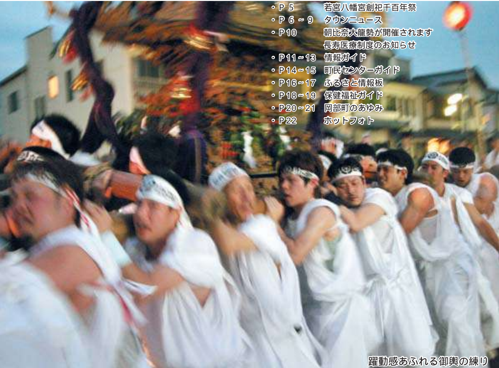
躍動感あふれる御輿の練り