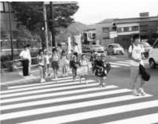
役場前交差点での街頭指導のようす

7/5 保健福祉センターで、社会福祉協議会主催の「ふれあい広場」が開催されました。これは、福祉に対する理解を深めてもらい、やすらぎのある福祉のまちづくりを目指して、毎年開かれています。 会場では、チャリティーバザーやもくせいのお家の自主製品販売、介護相談や介護機器の展示などが行われました。また、「シルバースター」の皆さんによるバンド演奏や、楽舞会、ほほえみの会、ハーモニカ同好会、岡部おはなしの会の会員による舞踊や演奏などのふれあいコンサートも開かれ、地域の人と福祉関係者の交流が図られました。