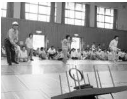
競技を楽しむ老人クラブ会員