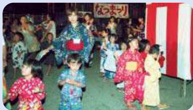
音楽と和太鼓に合わせて盆踊りを楽しむ子どもたち