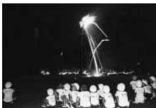
朝比奈第一小学校で行われたお盆の伝統行事灯ろう上げを見守る児童。(昭和58年)