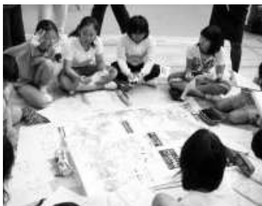
地図を見ながら危険なところを話し合う児童

7/1 平成21年10月24日から11月8日まで開催される第24回国民文化祭・しずおか2009の藤枝・岡部実行委員会の総会が、藤枝市役所で開かれました。大会の愛称「はばたく静岡国文祭」と、親しみやすいロゴマークも決まりました。平成21年には、藤枝市内でお茶や文学、街道文化にちなんだイベントが予定されています。総会では、9月から開催されるプレ大会の事業計画が協議されました。岡部町では、9月13日から14日に「第21回東海道シンポジウム岡部大会」が開催されます。(4ページ参照)