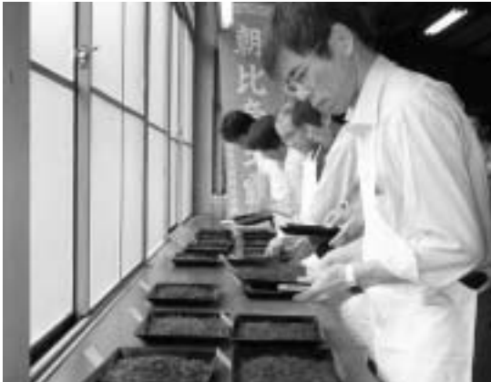
茶葉の外観を確認する審査員