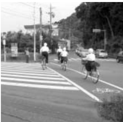
1人ひとりの安全意識が交通事故を防ぎます