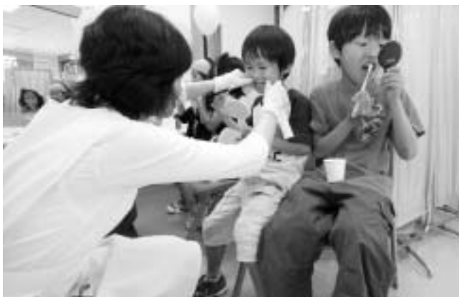
鏡を見ながら1本1本丁寧に歯磨きする子どもたち

痛ましい事故を増やさないために、道路を利用するすべての人が交通ルールとマナーを守り、交通安全に取り組みしましょう。