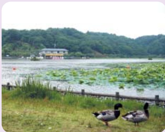
夏には、蓮の花が訪れた人の目を楽しませます