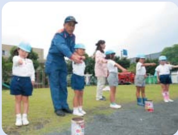
消防本部職員から花火の持ち方を教わる園児