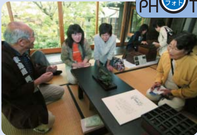
ガイドボランティアの説明を熱心に聞く来場者

柏屋では、香が燃える速度で時を知らせる香時計や、明治・大正時代の掛時計や懐中時計など珍しい時計の数々が展示されました。来場者は香時計がゆっくりと時を刻む様子を眺め、時の大切さを見つめなおしていました。