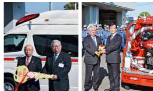
▲寄贈された救急車(左)と軽ポンプ車

12月5日、日本損害保険協会から、地域の防災力を高めて欲しいと、小型動力ポンプ付き軽消防自動車... 寄贈された消防車は、市消防団第15分団1班(朝比奈地区羽佐間)に配備しました。