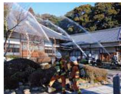
▲きびきびとした動きで一斉放水する署員たち

文化財防火デーの1月26日、市消防本部は、下之郷の長慶寺で消火訓練を行いました。この訓練は、指定文化財を火災から守るため、いざというときに現場で有効な消火活動が行えるよう、指揮系統の確認を行うものです。