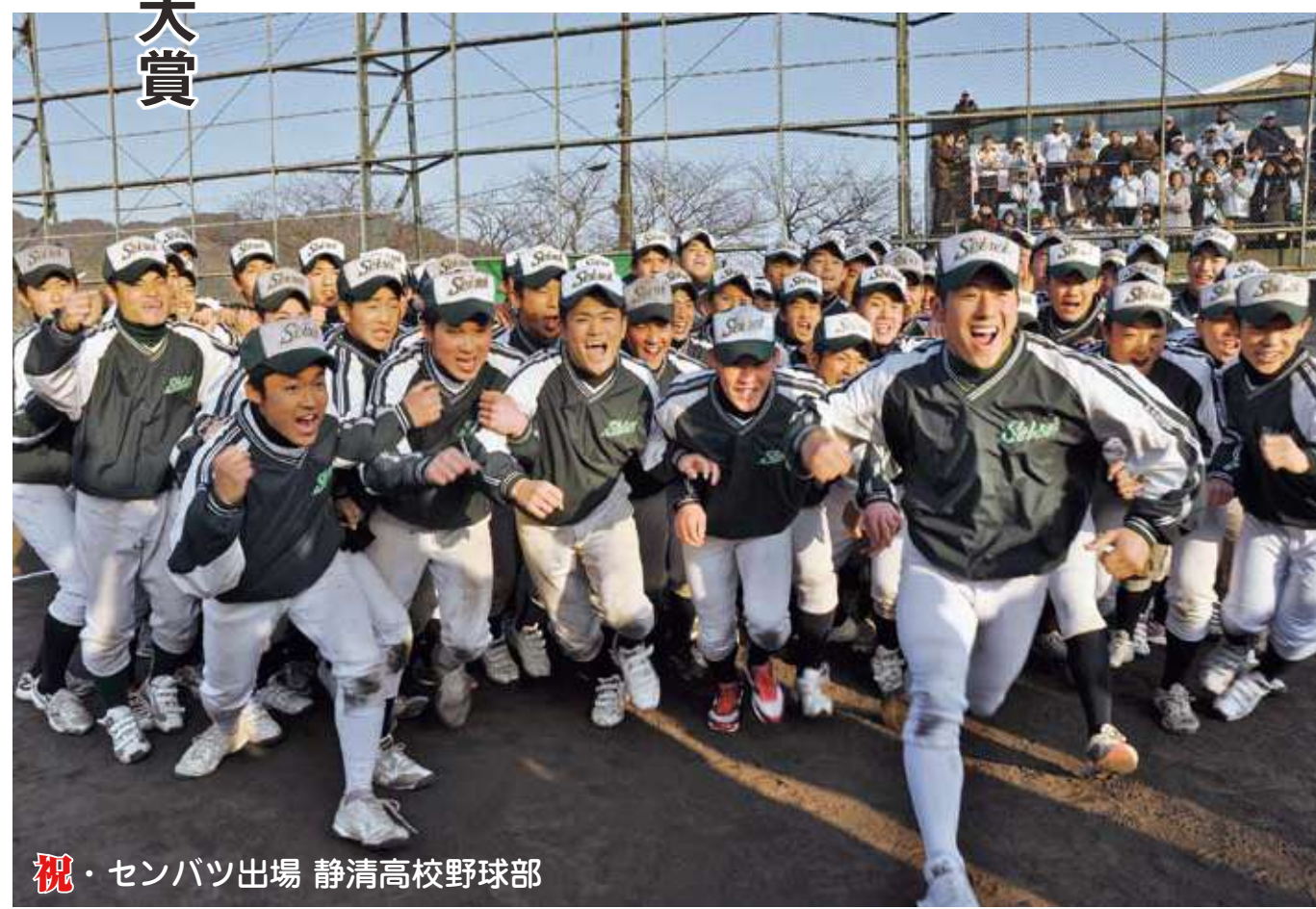
祝・センバツ出場 静清高校野球部