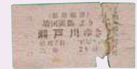
▲駿河岡部より瀬戸川ゆきの切符

昭和10年度の1日の平均乗客数は69人、貨物量は3.9トンと非常に少なく、赤字路線でした。急速に発達したバス・トラックに、客や荷物を奪われたことが営業不振の背景です。