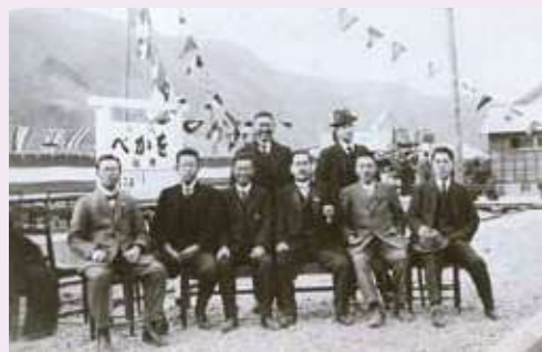
▲岡部線開通式の記念写真（駿河岡部駅にて）

奈村の4町村が藤相鉄道株式会社へ路線延長を働きかけたことに始まります。岡部・朝比奈・葉梨地区の特産であるみかんやお茶を、東海道線の藤枝駅まで貨物輸送することを期待してのものでした。そこで、建設費用の約20万円（現在の価値で約3億円）の大部分は4町村が負担しました。大正12年に線路の敷設工事を開始。同14年1月15日に駿河岡部駅の構内で盛大な開通式が行われ、翌日から営業運転が行われました。