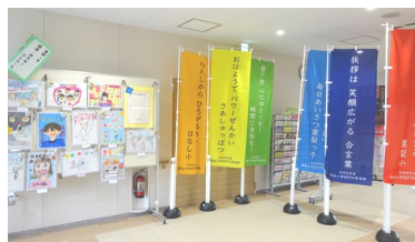
(標語は、『のぼり旗』として 展示してあります。)

葉梨小学校PTAでは、今年度、あいさつと交通安全をテーマに『葉梨っ子 標語・ポスターコンクール』を実施し、子どもたちから標語とポスターを募集しました。最優秀賞と優秀賞に選ばれた作品は、葉梨地区交流センターのロビーに展示してあります。交流センターにお越しの際は、ご覧ください。