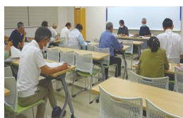
第2自治会(葉梨中学校)