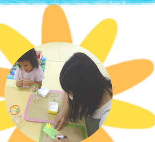
たなばた飾りとわくわく製作の様子