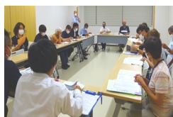
第1自治会 (葉梨西北小学校)