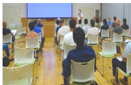
第3,4自治会(葉梨小学校)