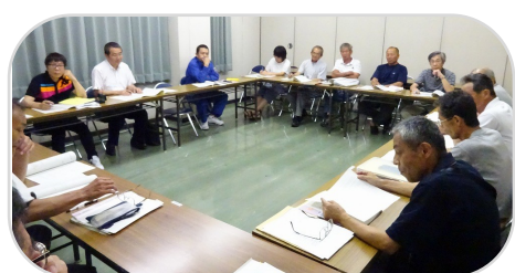
葉梨西北小学校区