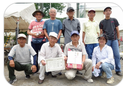
優勝 時ヶ谷第1Bチームの皆さん

日頃の練習の成果を発揮すべく、時おりホールインワンが出ると歓声上がり、白熱したゲームを展開しました。