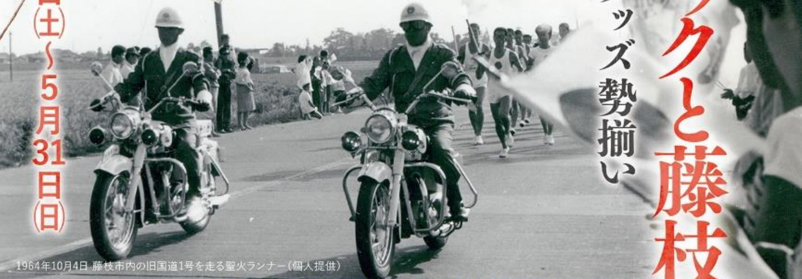
1964年10月4日 藤枝市内の旧国道1号を走る聖火ランナー