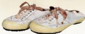
藤枝区間を走った聖火ランナーが使用した トーチ・ユニフォーム・シューズ(個人蔵)