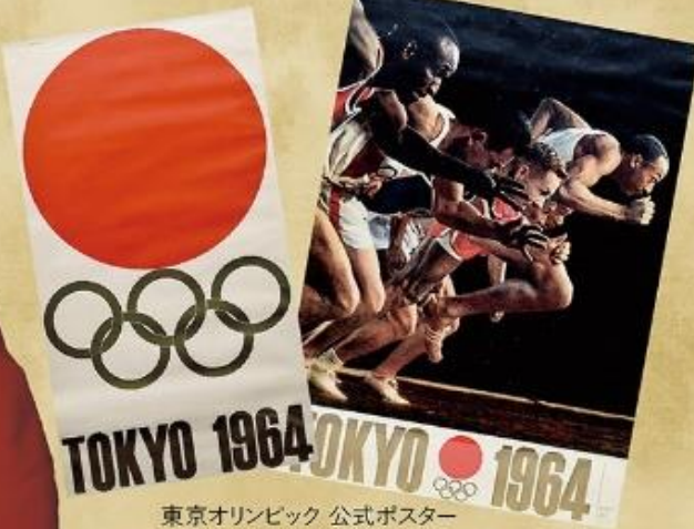
東京オリンピック 公式ポスター 第1号(1961年)・第2号(1962年)当館蔵