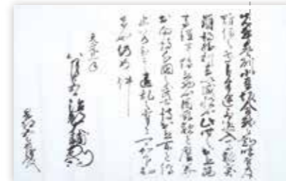
岡部家文書 今川義元判物 【藤枝市指定文化財】 当館像