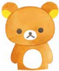
『リラクマ ここにいます』 主婦と生活社 2015年 © 2024 San-X Co., Ltd. All Rights Reserved.

本展では、デビュー作『木からおりたミカン』から最新作『ゆめぎんこう』まで、コンドウアキの作品を幅広く紹介します。繊細な色彩で描かれた直筆原画を通して、親しみのあるキャラクターや、日常に愛しい時間を届けてくれる作品の数々をお楽しみください。