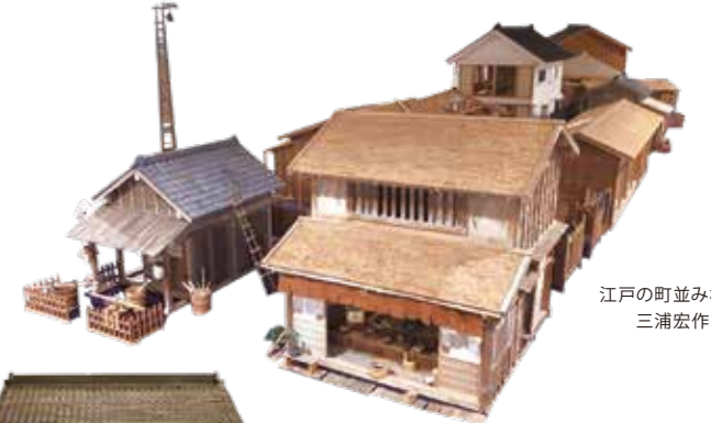
江戸の町並み模型 三浦宏作

鳶屋重三郎が力を注いだ浮世絵(錦絵) 出版の隆盛のなかで、葛飾北斎・歌川広重など有名絵師が手がけた浮世絵や、東海道五十三次シリーズなども展示する予定です。