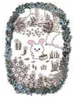
『うさぎのモフィ もりのまいにち』 主婦と生活社 2021年