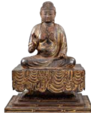
阿弥陀如来坐像 平安時代後期 【大阪府指定文化財】 岸和田市教育委員会所蔵

本展では、戦国乱世を生き抜いた両氏の軌跡や興亡を、貴重な歴史資料でたどります。また、中世の岡部氏菩提寺だった「万福寺」(廃寺・藤枝市仮宿)の本尊・阿弥陀如来坐像【大阪府指定文化財】が、約百年ぶりに藤枝に里帰ります。