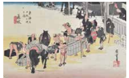
歌川広重画の保永堂版東海道「藤枝・人馬継立図」 見て楽しい立体ジオラマをお披露目予定