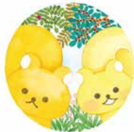
『リーとスーのどこ?どこ?どこ?』 教育画劇 2019年 © aki kondo/SCP