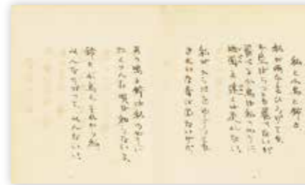
みすゞ自筆の遺稿手帳「私と小鳥と鈴と」の箇所