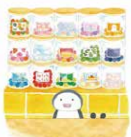
『ゆめぎんこう』 白泉社 2020年 © aki kondo

2024.8.24 (土) ▶ 10.20 (日) 同時開催/没後10年 魂の俳人 村越化石展