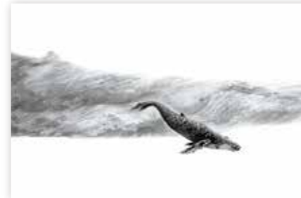
尾崎眞吾画「鯨法会」 絵本『海とかもめ』より

2024.10.26 (土) ▶ 12.8 (日) 同時開催/藤枝・岡部の中世文学 ~紀行文・軍記物の世界~