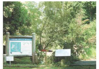
市民の森ビオトープガーデン (杉山ほか監修。藤枝市瀬戸ノ谷)