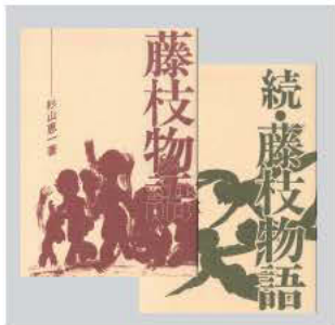
自伝的小説『藤枝物語』 『続・藤枝物語』

著書に『藤枝物語』『関ヶ丘物語』『ビオトープの形態学』『ハチの博物誌』などがある。