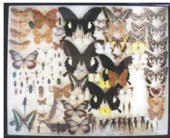
杉山による昆虫標本