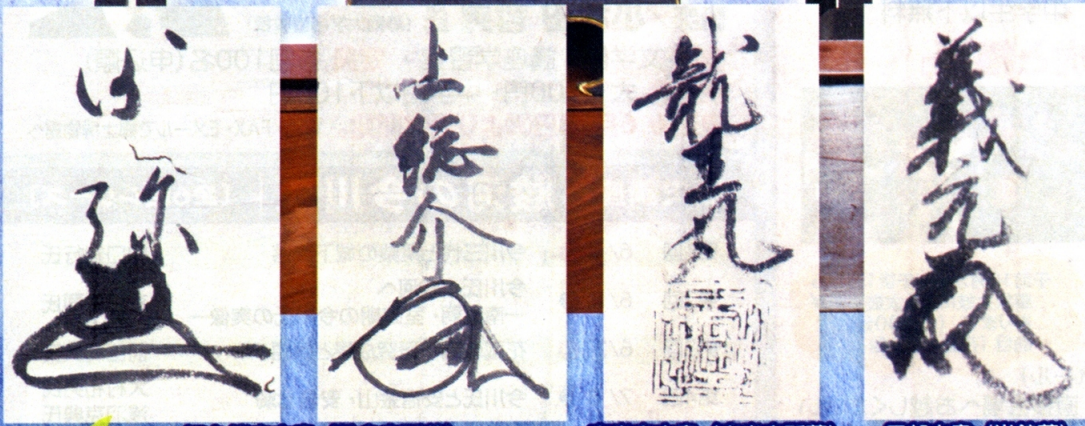
旧久能寺文書 (鉄舟寺所蔵)