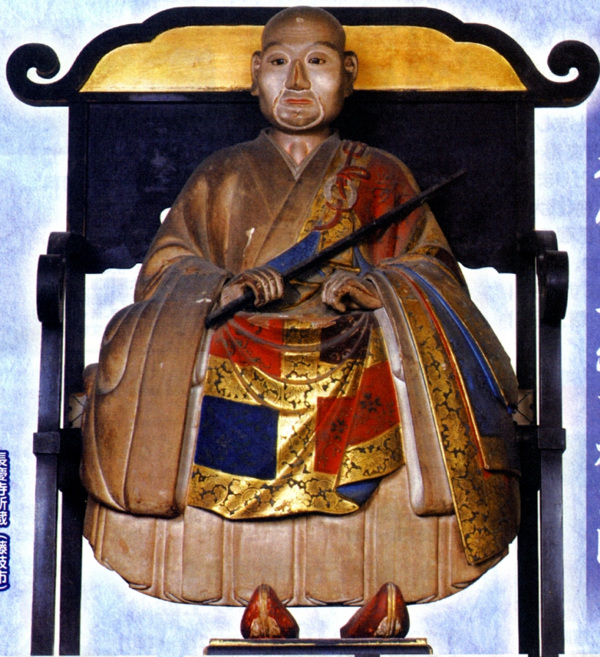
長慶寺所蔵 (藤枝市)