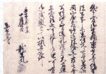
龍王丸(今川氏親)黒印状 長享元年(1487) 東光寺(島田市)所蔵