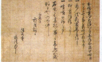
清水寺門前で年2回の新町開催を認める今川氏真朱印状 永禄4年(1561) 清水寺(藤枝市)所蔵