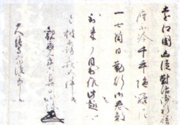
旧久能寺文書 今川範国書下 観応3年(1352) 鉄舟寺(静岡市)所蔵