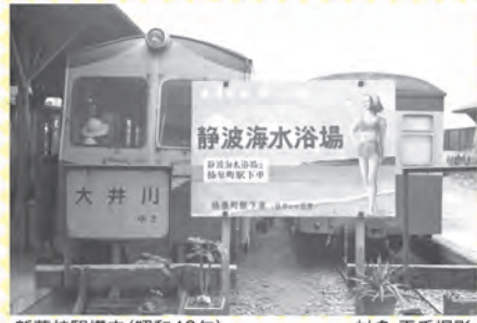
新藤枝駅構内(昭和43年)