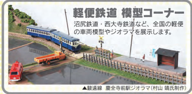
▲駿遠線 慶全寺前駅ジオラマ(村山 靖氏制作)