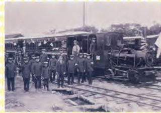
▲開業当時の藤相鉄道藤枝新駅