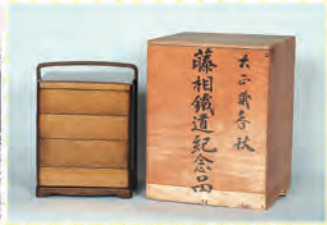
▲藤相鉄道開業記念の重箱(大正2年)