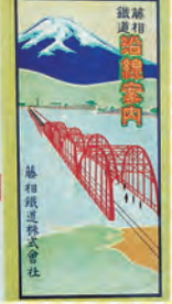
▲藤相鉄道 沿線案内(大正13年)