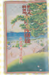
▲中遠名所図絵(中遠鉄道沿線案内)