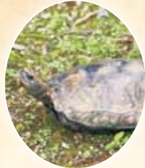
蓮華寺池の在来種 ニホンイシガメ