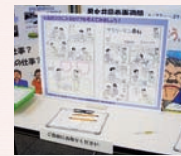
「男だてら」に「女泣き」ジェンダーと男女共同参画社会入門 奥山和弘著より