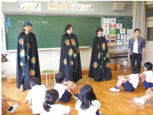
3人の講師はマント姿で登場！