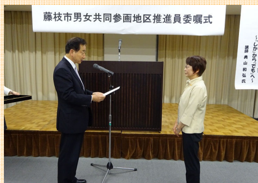
北村市長より委嘱状交付

地区推進員の皆さんは4月と5月に研修後、6月にテーマを決め、7月から各地区ごとに活動を展開していきます。