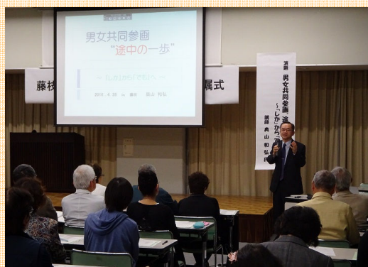
講師の話に聞き入る第3期地区推進員の皆さん