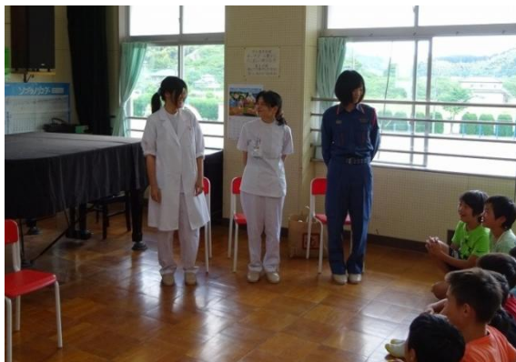
マントを脱ぐと制服姿に！