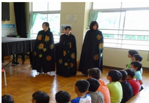
マントをはおって講師登場

藤枝市では、性別のイメージにとらわれないで職業をえらんで活躍する講師から話を聴き、さまざまな職業について学ぶ「マイジョブ講座」を、平成25年度より実施しています。4年目となる本年度は、6月2日（木）に、葉梨西北小学校からスタートしました。