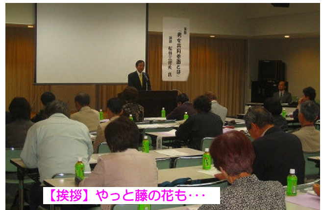
【挨拶】 やっと藤の花も…