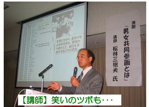
【講師】 笑いのツボも…