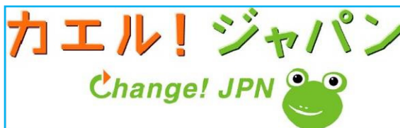
ワーク・ライフ・バランスのロゴマーク