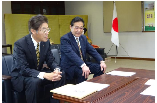
大塚専務(右)と西川総務部長(左)