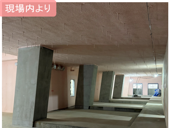
躯体工事とともに進む内装工事