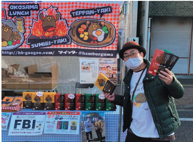
レトルトハンバーグの認知度上昇中です！