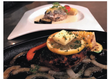
cafe&taveran 縁和 「静岡県産レモンソースのハンバーグ」

平日夕方4時50分~放送の情報バラエティ番組『まるごと』の人気コーナー「銀シャリの旅はナビまかせ」。昨年12月の放送に続く藤枝駅前特集第2弾として、人気お笑い芸人「銀シャリ」の二人が田形によるナビゲーター動画の指示を受けて、中心市街地の魅力にふれてくださいました。「ジロロア」さんの評判のスイーツを皮切りに、藤枝ならではの新作ハンバーグが続々と紹介されます。