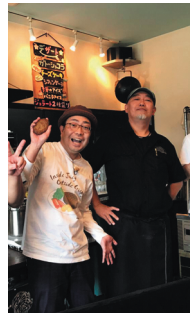
☉ cafe&taveran 縁和にて

(だいいちテレビ) 7月6日(月)13日(月)と 2週連続放送 藤枝駅前特集 第2弾を ナビゲート!