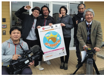
◎株式会社 信光(藤枝市築地561-1)にて『ORANGE』(SBS) 3月17日(火) ※こんにやくミートを使った肉不使用のハンバーグを紹介

2月16日(日) 読売新聞朝刊 「静岡ひと」のコーナーで 「ソウルフード定着へ奔走」と題して紹介されました。