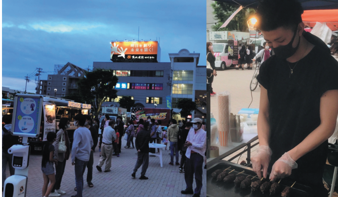
早い時間帯から大勢の来場者で賑わいました