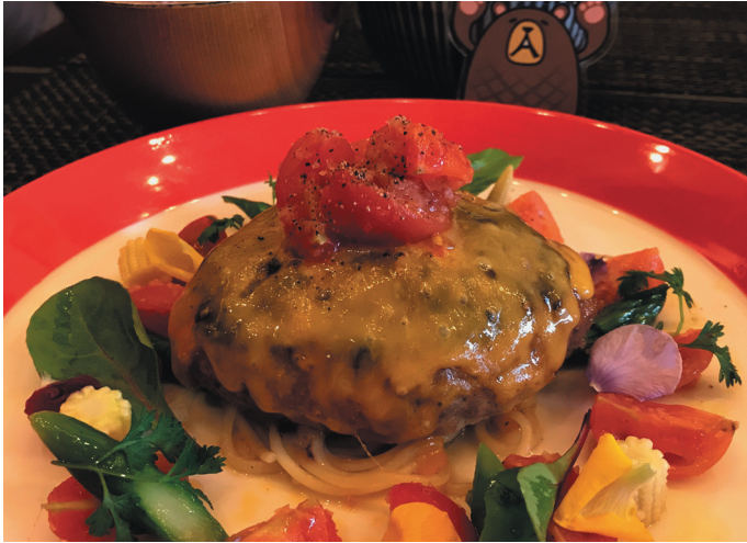
参加者全員から大好評！藤枝コラボのハンバーグ♪