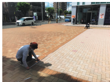
会場の計測も行い、着々と準備を進めています