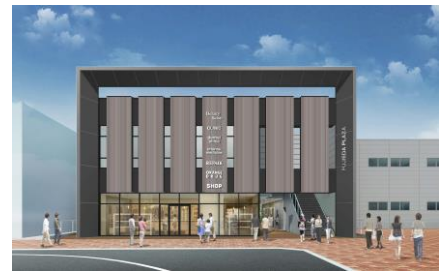
商業棟完成イメージ