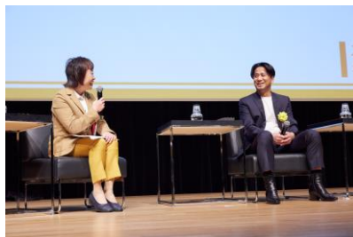
トークセッションの様子