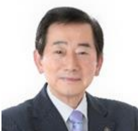
藤枝市長 北村 正平 氏