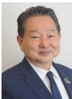
東御市長 花岡 利夫 氏