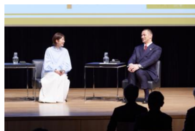
トークセッションの様子