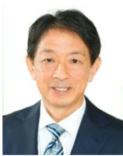
美浜町長 八谷 充則 氏