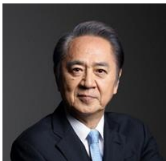
横須賀市長 上地 克明 氏