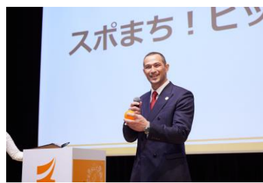
スポまち！ピックアップの様子

〈本資料に関する報道関係者様からのお問い合わせ先〉「スポまち！長官表彰2023」運営事務局