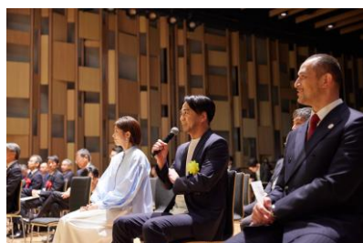
スポーツ・健康まちづくりデザイン学生コンペティション2023の様子