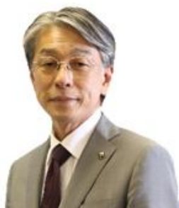
田辺市長 真砂 充敏 氏