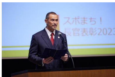
室伏長官による開式挨拶の様子