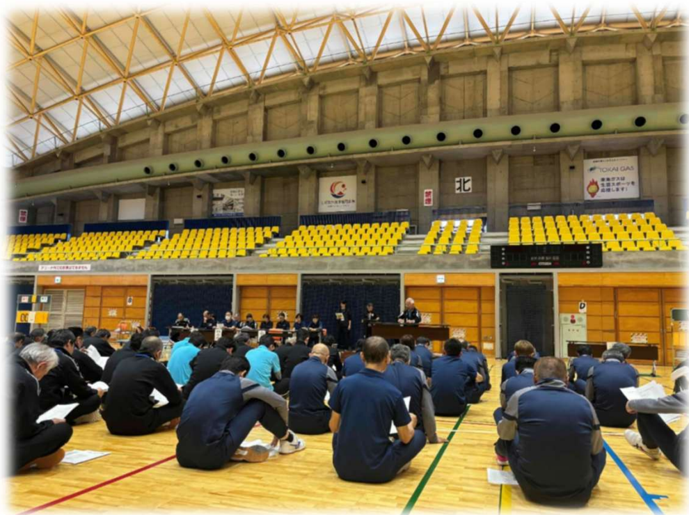
令和7年度志太スポーツ推進委員連絡協議会総会(5/10)にて