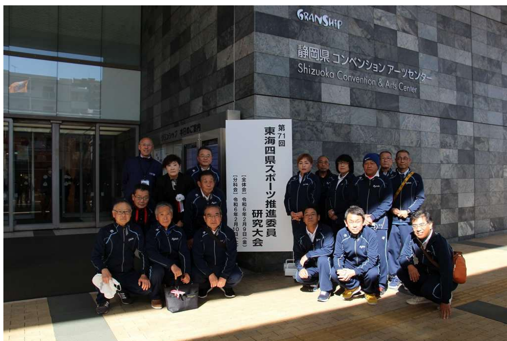
東海四県スポーツ推進委員研究大会(2/9-10)にて