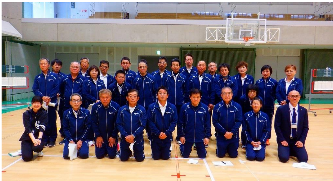
志太地区スポーツ推進委員連絡協議会総会・実技交流会(5/13)にて