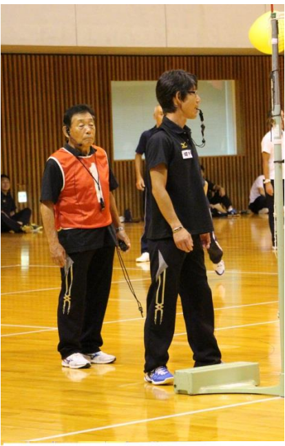
静岡県スポーツ推進委員実技研