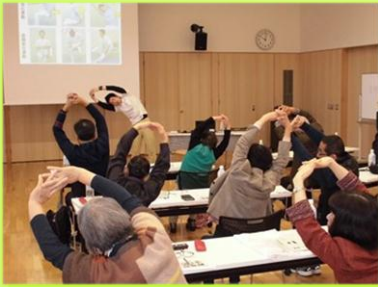
ロコモ予防について学ぶ

講習会では、理学療法士を講師に運動器の機能の低下を防ぐためのロコモティブシンドローム予防について学び、