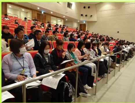
説明を聞く事業所の職員

平成30年3月28日(水)に藤枝市民会館ホールにおいて、介護保険制度の改正等に関する事業所説明会を開催し、約250人の市内介護保険事業所の職員が出席しました。新たに策定した介護保険事業計画「第7次ふじえだ介護・福祉プラン21」の骨子や4月からの介護保険料など制度改正の概要について介護福祉課の担当職員が説明を行いました。