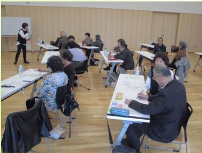
コミュニケーションについて学ぶ

講習会では、理学療法士を講師に運動器の機能の低下を防ぐためのロコモティブシンドローム予防について学び、