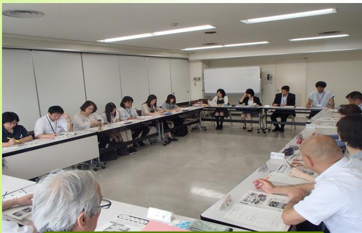
団体代表者との協議

高齢化に伴い多種多様化する地域課題に対し、市内全体が一丸となって解決できるよう、各分野間の連携強化に努めます。